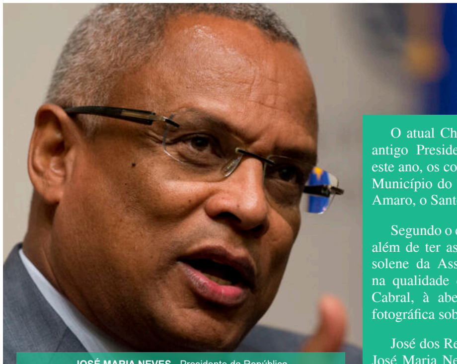
JOSÉ MARIA NEVES - Presidente da República